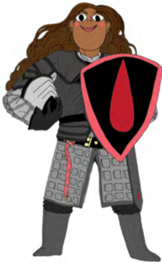
Illustration : Mirion Malle